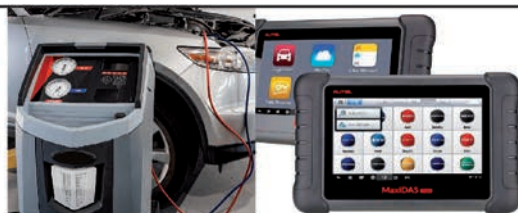
AIRE GIROTUA - 2 GAS MARKA GUZTIEN DIAGNOSIA