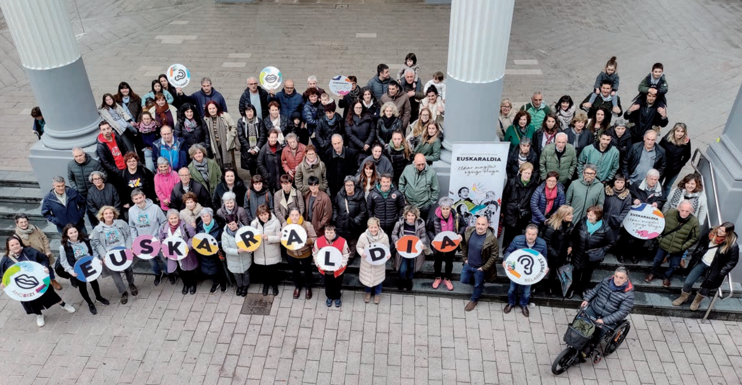
Ordizian Euskaraldirako herritarren eta ordezkarien argazkia, martxoan. Loinaz Agirre