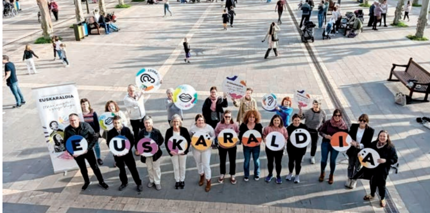
Goierriko euskalgintzako ordezkariak, Lazkaon. Goiberri