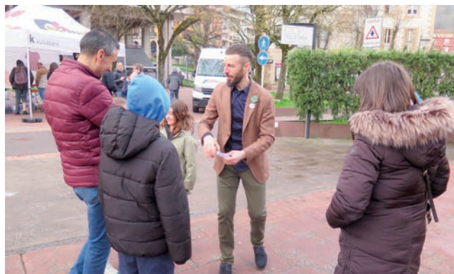
Informazio gunean Kidam magoa, Urretxun. A.Z.