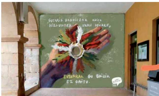
Beasainen horma-irudia, Alain Polok diseinatua.