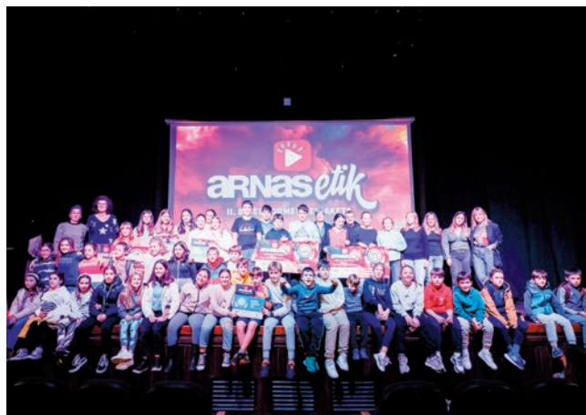
Arnasetik bideo sormen lehiaketa, 2023an.

2 Historia aztertu. Azken ehun urteetako euskararen historiak gainbehera, indarberritzea eta gelditze aroak izan ditu. Horiek historikoki aztertu beharrekoak dira. Euskara etxean jasotzeko joera galdu zen XX. mendean zehar. Galera prozesuan, ordea, Euskal Pizkundea salbuespena eta itxaropen aroa izan zen. 1960ko hamarkadan euskara batua, ikastolak, gau eskolak, euskal kantagintza berria eta beste hainbat ekimen sortu zituzten. XXI. mendean moteltzen hasi direla sumatu dute.