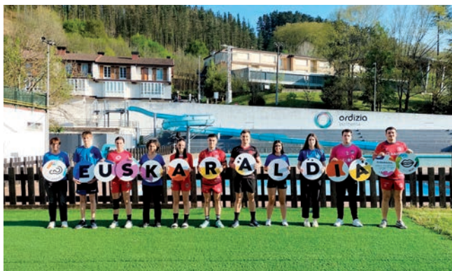
Ordiziako kirol klubak. Goiberri